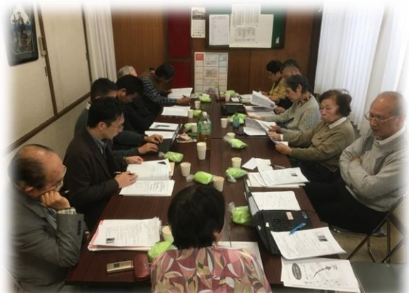
実行委員会の様子。(左は絵の選定作業)